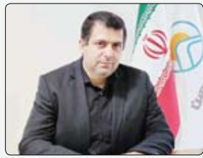
بیمه مرکزی جمهوری اسلامی ایران با