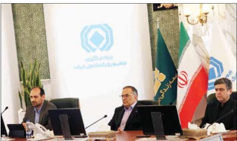
دو اقدام نوآورانه در کارنامه خود به ثبت رسانده، با این وجود با توجه به رویکرد بیمه مرکزی مبنی بر تکثیر نوآوری و بدعت در صنعت، از تمام همکارانم خواستام

افزود: از سوی دیگر، گاه نوآوری‌هایی در صنعت بیمه انجام می‌شود که به دلیل عدم اطلاع‌رسانی، مغفول می‌ماند. در چنین شرایطی سرمایه‌گذار نیز انگیزه‌های برای ورود سرمایه خود به صنعت بیمه پیدا نمی‌کند. ضمن اینکه اگر نوآوری یک شرکت بیمه اطلاع‌رسانی نشود، ممکن است سایر شرکت‌های بیمه‌گر ضرورت ایجاد تحرک و خلاقیت را در نیابند. بنابراین برگزاری چنین نشست‌هایی با هدف تأکید بر اهمیت ارائه نوآوری شرکت‌های بیمه در وجوه مختلفی اهمیت خود را نشان می‌دهد. مدیرعامل بیمه باران با اشاره به ضرورت ارائه نوآوری برای شرکت‌های تخصصی گفت: از آنجایی که بیمه باران به صورت تخصصی در زمینه ارائه بیمه‌های زندگی فعالیت دارد، ضروری است که نوآوری‌های خود را در جهت طراحی محصول، عرضه و ارائه آن به بهینه‌ترین شکل ممکن نشان دهد. با عنایت به همین ضرورت، در بدو ورود بیمه باران به صنعت بیمه، تلاش شد محصولی وارد صنعت بیمه شود که تا پیش از این وجود نداشت.