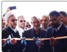
بیست و دومین مدرسه شهدای بانک مسکن که در راستای عمل به مسئولیت اجتماعی در روستای نمونه کشوری گنجان

میزان تسهیلات اعطایی توسط بانک آینده در مهرماه امسال، نسبت به ماه قبل با رشد ۱/۳ درصدی (یک و سه دهم) همراه بوده و از این حیث این بانک در رتبه چهارم بانک‌های خصوصی قرار گرفته است. کارت اعتباری، تسهیلات قرض‌الحسنه ازدواج، طرح‌های «کارا» و «طراوت» از جمله ابزارهای پرداخت این تسهیلات هستند.