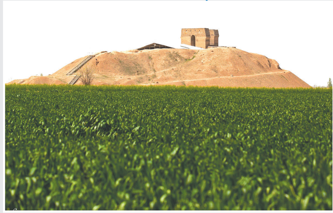
آتشکده «بهرام ری» جاذبه تاریخی تهران آتشکده «بهرام ری» در جاده ورامین و در نزدیکی روستای قلعه نوبر فراز تپه های موسوم به تپه میل قرار دارد.

کتاب می خوانیم: «تصاویر از میان تار یکی پیدایشان می شود. این تصویر هم یکی مثل بقیه. مرد باستانی، مردی سی و هفت یا سی و هشت ساله، با موی بلند، ریش کوتاه، هیکل و قامتی بزرگ، پوستی سفید، تنوی کلبه ای محزون، کنار تختی کوچک نشست است.