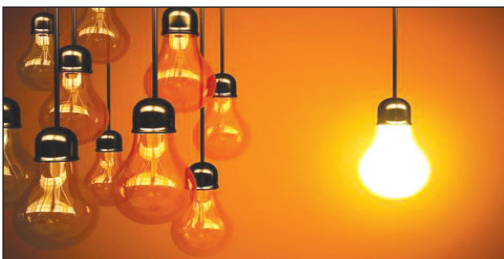
خورشیدی مجهزند. پیش تر بانک ملی ایران موفق شده است گواهی

به گزارش روابط عمومی بانک ملی ایران، هم‌زمان با کاهش مصرف برق شبکه تاحد ممکن، استفاده از انرژی خورشیدی به منظور تامین برق مصرفی برخی واحدها در این بانک با دقت در جریان است. شعب مرکزی، سعدی، حافظ و ساختمان مدیریت واقع در محوطه ادارات مرکزی بانک ملی ایران از جمله مراکز آند که به نیروگاه