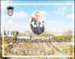
این شرکت با آن مواجه است.

مدیرعامل ذوب آهن اصفهان چالش‌های این شرکت را عنوان کرد و گفت: بحران آب در اصفهان، تحریم ه‌ا، ویروس کرونا، محدودیت ظرفیت تولید زغال سنگ کشور، عدم تناسب قیمت گذاری زغال سنگ داخلی در مقایسه با زغال سنگ خارجی از چالش‌هایی است که این شرکت با آن مواجه است.