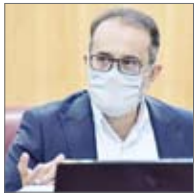
مدیرعامل شرکت گاز استان بوشهر

بوشهر– تجارت: مدیرعامل شرکت گاز استان بوشهر گفت: تاکنون در شهرستان دیلم افزون بر ۳۹۴ کیلومتر شبکه اجرا شده است.