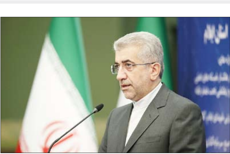
وزیر نیرو در جریان بازدید از سد کرج در استان البرز

در جلسه‌ی رأی اعتماد مطرح کردم و هم در جلسات دیگر ارائه دادم، با تأکید عرض می‌کنم که ما در ارتباط با بحث‌های انتقال آب بین حوضه‌ای هیچ طرحی را بدون مجوز زیست محیطی اجرا نکردیم و نمی‌کنیم.