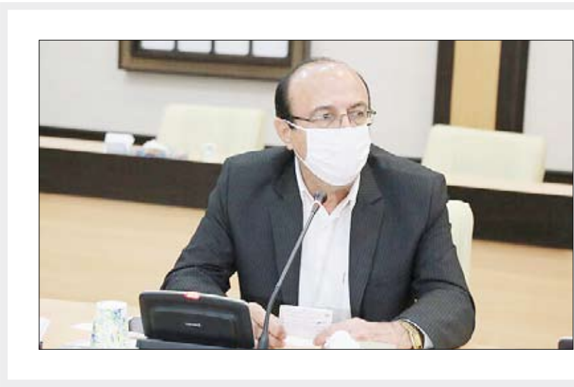
مدیرکل آموزش و پرورش بوشهر