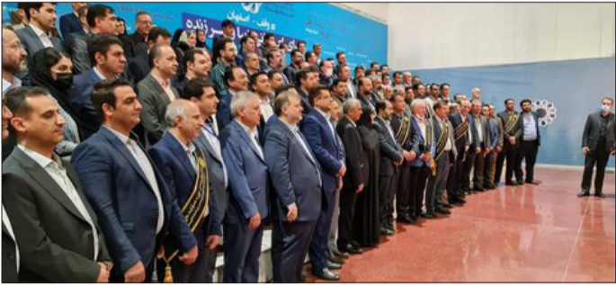
که فولاد مبارک در این رویداد موفق به کسب رتبه اول در بخش سازمانی شد.