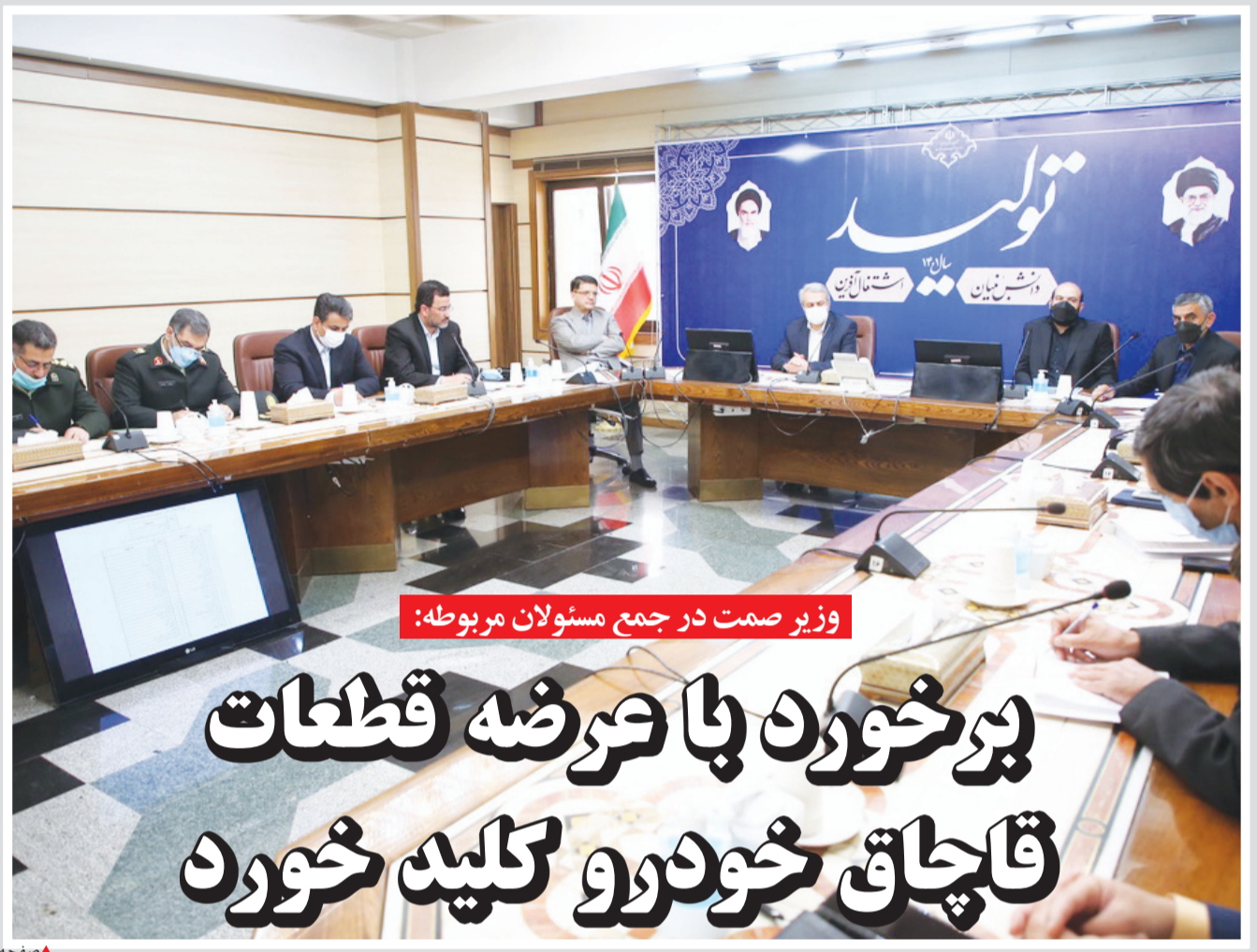
وزیر صمت در جمع مسئولان مربوطه:

اخیرا برخی استانداران و فرمانداران و جمعی از مسوولان برای مردم ومعیشت بد آنها پشت دوربین گریه می کنند! برخی از آنها در فضای مجازی می نویسند که شبی نیست بخاطر مشکلات معیشتی مردم نیمه شب از خواب بر نخیزد! بخصوص اینکه در سالی که گذشت، مردم و به خصوص قشر متوسط به پایین وضعیت خوبی را سپری نکردند. فشار تورمی و کاهش قدرت خرید عموم جامعه باعث شد تا سطح رفاه مردم به شدت پایین بیاید. این گریه ها و فیلم هایی که نشان می دهد مسوولان نگران معیشت مردم هستند بیشتر شبیه فیلم های کمدی است. برخی مسوولان نیز متاسفانه بجای ایجاد راهکار حرفهایی می زنند که حکم نمک پاشیدن به زخم مردم است. چندی پیش یکی از آنها گفته تحریمها مردم ما را از نظر اقتصادی مقاوم کرده است و الان در برابر تمام مشکلات معیشتی و فراز و نشیبهای اقتصادی، مردم ما مقاوم اند. از سویی دیگر به نظر می آید، ظاهرا مساله‌ای که برای نمایندگان مجلس اهمیت ندارد، موضوع آب و نان است. مردم در شرایط سختی به سر می‌برند و مشکل آنها مساله اقتصادی است و مسوولان نباید به موضوعات حاشیهای بیوزن و اولویت آنها حل مشکلات اقتصادی باشد. ادامه در صفحه ۲