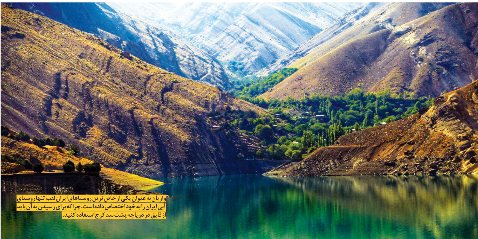
واریان به عنوان یکی از خاص ترین روستاهای ایران لقب تنهاروستای آبی ایران را به خود اختصاص داده است، چرا که برای رسیدن به آن باید از قایق در دریاچه پشت سد کرج استفاده کنید.