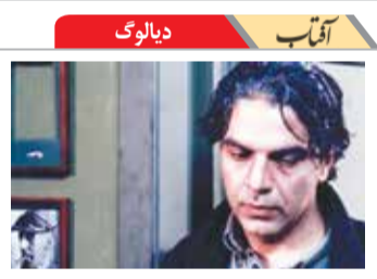
حرفای خوب همیشه مال آدمای خوب نیست. شب های روشن - فرزاد مومتن

یا از چراغ سبز بعضی‌ها به ترامپ گفتید. خب همه میدانند منظورتان از بعضی‌ها نمایندگان مجلس و مصوبه مجلس بود. اما این هم چیز جدیدی نیست. مگر با این حرفها بخواهید مردم را به جان نمایندگان بیاندازید؟ مجلس و نمایندگان را چشم مردم بیاندازید؟ بعد مدت‌ها غیبت و سکوت آمدید و سخنانی می‌گویید که دو بهم زنی کنید؟ شما که بعد از لغو برجام و اعمال تحریم‌ها نتوانستید آثار تحریم‌ها را خنثی کنید و هر چه فشار رو مردم آمد و هر که داد و ناله‌اش در آمد پاسخ دادید: می‌خواهید ناسزا ببینید آدرس غلط ندهید. مستقیم ناسزایان را به کاخ سفید بفرستید. بعد هم جل و پلاس دولت را جمع کردید و رفتید و بی‌خیال مردم و کلید و قفل و حتی رنگ بنفش (رنگ تبلیغات انتخاباتی) شدید. اکنون آثار تحریم‌ها خنثی شده. معیشت ما هم به مذاکرات گره نخورده. فقط کمی گره به زندگی‌مان افتاده.