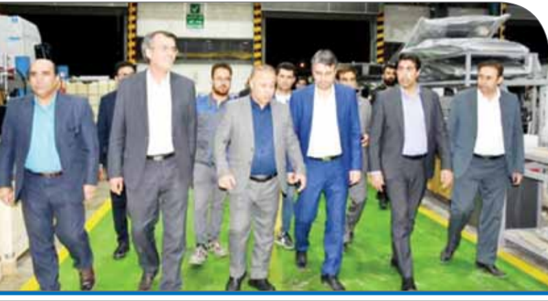
ایدرو با توجه به ظرفیت‌های خود، آمادگی حمایت از سرمایه‌گذاران در منطقه ویژه اقتصادی چهرم را دارد

رشد و توسعه اقتصادی استان‌ها براساس فرصت‌ها و امکاناتی که دارند، یکی از اهداف سازمان گسترش و توسعه اقتصادی استان است. در این راستا، چهرم یکی از مناطق ویژه اقتصادی در استان فارس بوده که با هدف توسعه صادرات و ایجاد تحرک در صنعت و تجارت راه‌اندازی شده است. حضور در بازارهای جهانی و تولید و صادرات کالا، رشد و توسعه اقتصادی استان و بهره‌گیری از توانایی‌های بالقوه استان فارس، تشویق سرمایه‌گذاران داخلی و خارجی برای ورود به عرصه تولید، اقدام عملی در جهت ایجاد اشتغال و کاهش نرخ بیکاری در استان، جذب سرمایه‌های داخلی و خارجی و استفاده از چرم عظیم نقدینگی موجود در استان فارس که در حال حاضر پس از تهران مقام دوم کشور را داراست، جذب دانش و انتقال فناوری از طریق همکاری علمی و صنعتی با شرکت‌های بین‌المللی و حمایت از صنایع و صنعتگران داخلی و ایجاد تسهیلات برای آنها از دیگر اهداف ایجاد این منطقه ویژه اقتصادی است.