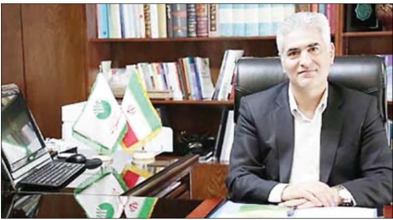
بنیان و نوآور تسهیلات پرداخت کرده است. ادامه داد: ۴۱۸۵۴۰۰ میلیون ریال از این تسهیلات از منابع صندوق نوآوری و شکوفایی، ۱۵۲۵۱۶۸ از منابع صندوق توسعه ملی و ۲۳۸۹۵۲۷۰۶۳ میلیون ریال