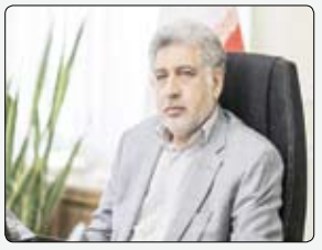
سرپرست بانک مسکن با اعلام اینکه...

موسسه اعتباری ملل در راستای ایفای مسئولیت های اجتماعی مبنی بر اعطای وام قرض الحسنه، بخشنامه تسریع و تسهیل پرداخت وام قرض الحسنه ازدواج را به کلیه شعب صادر کرد. به گزارش روابط عمومی موسسه اعتباری ملل: متقاضیان محترم می توانند پس از ثبت نام در سامانه ازدواج بانک مرکزی هر یک از شعب موسسه را برای دریافت وام قرض الحسنه ازدواج با معرفی واداکتر یک نفر ضامن معتبر که دارای اهلیت و جوایز اعتباری باشد انتخاب نمایند.