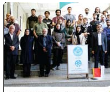
تقدیر همراه اول از پایان‌نامه‌های برتر هجدهمین رویداد روز پروژه

عنوان پایان نامه برتر توسط نمایندگان مرکز تحقیق و توسعه همراه اول معرفی و از آنها تقدیر شد. نماینده مرکز تحقیق و توسعه همراه اول در این مراسم ضمن تقدیر و تجلیل از پایان نامه‌های برتر این رویداد، در سخنانی