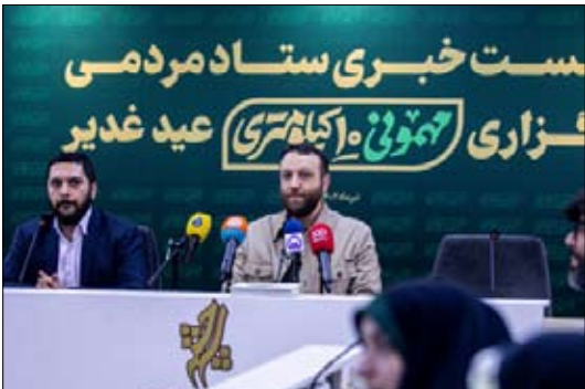
افقادی به ثبت نام کردند تا بتوانند از مهمانان شرکت کننده پذیرایی کنند.

■ پوشش «لقمه میلیونی» برای اطعام روز غدیر دبیر ستاد برگزاری «مهمونی ۱۰ کیلومتری» افزود: بهره بردن از ظرفیت مردم در برگزاری «مهمونی ۱۰ کیلومتری» بسیار مورد تأکید بزرگان قرار گرفته است، چرا که مردم عنصر پیشسرفر در گام دوم به شمار می روند. زارع گفت: چند روزی است پوششی با عنوان «لقمه میلیونی» رونمایی شده است؛ روایتی از امام صادق (ع) بیان شده که در آن تأکید می شود در روز غدیر به مؤمنین اطعام داده شود و حضرت می فرماید ثواب اطعام یک مؤمن در روز غدیر با اطعام یک میلیون پیامبر، صدیق و شهید در خانه خدا برابری می کند؛ در هیچ عیدی به اندازه روز عید غدیر خیر توصیه به اطعام دادن نشده است و به دلیل اشتیاق زیادی که برای اطعام روز غدیر در بین مردم وجود دارد این پوشش، «لقمه میلیونی» نام گرفت. دبیر ستاد برگزاری «مهمونی ۱۰ کیلومتری» افزود: بر همین اساس ادوار تشکیل های دانشگاه خواجه نصیر با یک اقدام سازماندهی شده در برگزاری این پوشش فعالیت خواهند کرد. خانواده هایی که دوست دارند حتی به اندازه یک لقمه در روز غدیر از مردم پذیرایی کنند با مراجعه به سامانه و سایت لقمه میلیونی اقدام به ثبت نام کنند؛ دلیل این ثبت نام فیلترینگ و رعایت مسائل بهداشتی است. زارع ادامه داد: ادوار تشکیل های دانشگاهی با برنامه های سازمان دهی شده از شب عید سعید غدیر به مراجعه به اقمی نقاط شهر تهران اقدام به جمع آوری لقمه ها می کنند و با رساندن آن لقمه ها به موبک ها، آنها را به دست مردم می رسانند. وی ادامه داد: پوشش دیگری که سال گذشته مورد استقبال قرار گرفت هدیه اسباب بازی بود که قریب به ۲۰ هزار اسباب بازی جمع آوری و بسته بندی شد و در اختیار کودکان مناطق