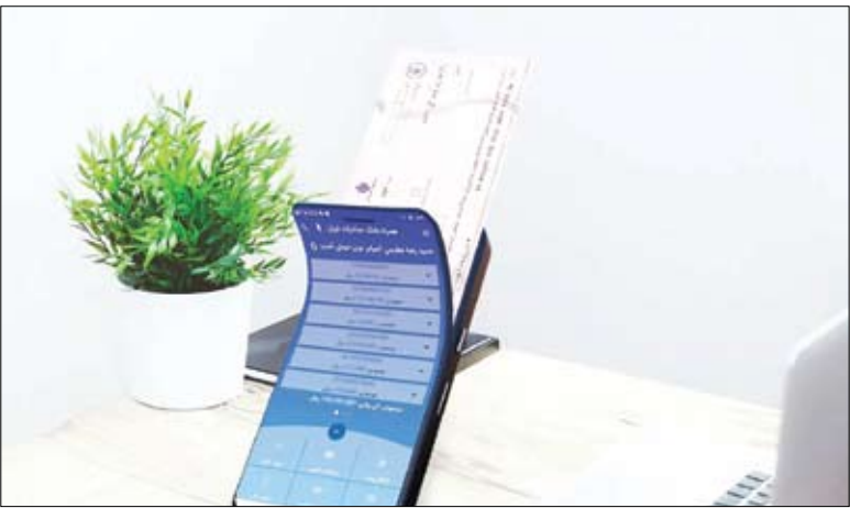
نظیر جعل یا سرقت چک، عدم امکان ویرایش اطلاعات چک پس از صدور، مشخص بودن روند نقل و انتقال چک، هزینه مربوط به دریافت دسته چک و نگهداری چک های دریافتی، امکان ارسال

سرعت بالا در صدور و پرداخت چک، صرفه جویی در مصرف کاغذ، امنیت بالا و کاهش جرائمی