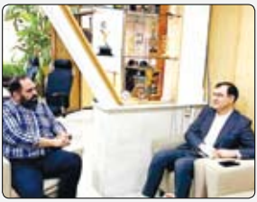
مدیرعامل بیمه البرز در دیدار با مدیر

مدیر عامل بانک توسعه تعاون با تبیین خدمات اعتباری و تخصصی ویژه تعاونی های صادرات گرا گفت: هفتاد درصد تسهیلات بانک متعلق به بخش تعاون است و ارکان بانک با هدف تقویت و توانمندسازی تعاونی ها مشغول فعالیت هستند و صادرات همواره یکی از مولفه ها و نشانه های فعالیت، سالم، همدمند و استاندارد هر واحد تولیدی و اقتصادی است و مجموعه بانک توسعه تعاون نیز این هدف را دارن تا با حمایت از تعاونی ها آنان را در موقعیت صادرات کالا و خدمات قرار دهند و با توجه به تنوع فعالیت تعاونی ها در سراسر مناطق جغرافیایی کشور، مزیت های مهم صادراتی به کشورهای مقصد و هدف وجود دارد-.