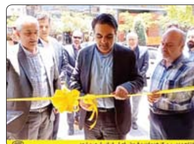
افتتاح دومین مرکز خدمات و فروش اصلی ایرانسل در مشهد

با افتتاح این مرکز خدمات و فروش، شهروندان کلان‌شهر مشهد به خدمات دومین مرکز فروش اصلی ایرانسل که در محدوده مرکزی این شهر و بلوار سجاد واقع شده است، دسترسی دارند. در مرکز خدمات و فروش اولین و بزرگترین اپراتور دیجیتال ایران در بلوار سجاد مشهد، تمامی خدمات فروش ایرانسل از جمله فروش محصولات جدید ایرانسل شامل انواع سیم‌کارت از جمله سیم‌کارت «۹۰۰۰» با قابلیت انتخاب شماره دلخواه، مودم‌های