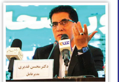
نخست‌خبری مدیرعامل هلدینگ پتروپالایش اصفهان در آستانه هفته دولت با رویکرد گزارش عملکرد ۲ ساله با حضور پروژه‌ها استفاده کرد.

تا سه سال آینده دو محصول پالایشگاه اصفهان یعنی بنزین و گازوئیل افزایش تولید پیدا خواهند کرد؛ به طوری که بنزین تولیدی در این مجتمع از روزانه ۱۳.۵ میلیون لیتر به ۲۲.۷ میلیون لیتر خواهد رسید همچنین تولید گازوئیل به ۲۶ میلیون لیتر افزایش خواهد یافت.