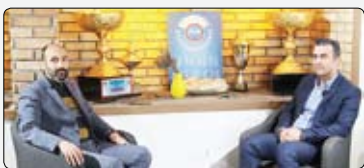
رئیس انجمن صنفی نمایندگان استان تهران بیمه رازی از تشکیل کانون نمایندگان این شرکت در آینده نزدیک خبر داد و گفت: تشکیل انجمن‌های صنفی هم صدای