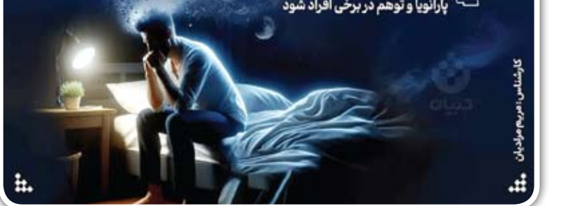
گزارش: مریم مایان

اختلالات روانی: محرومیت از خواب می تواند موجب علائمی مانند گیجی، پارانویا و توهم در برخی افراد شود