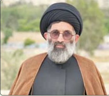
حجت الاسلام والمسلمین موسوی مطلق: بسم الله الرحمن الرحیم اللّٰهُمَّ اِنِّیْ اَعُوْذُ بِکَ مِنْ ... اَوْتَرُوْمَ مَا