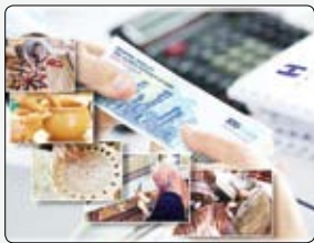
حجم تسهیلات تکلیفی و حمایتی بانک صادرات ایران در ۱۱ ماهه ۱۴۰۲ از ۲۷۴

بیمه پارسیان به مناسبت فرارسیدن فصل بهار، جشنواره بهاران زندگی پارسیان را برای تجلیل از بیمه‌گران بیمه‌های زندگی برگزار می‌کند. به گزارش گزارش روابط عمومی بیمه پارسیان؛ به منظور قدردانی از وفاداری و همراهی بیمه‌گران، تکریم مشتریان و همچنین با هدف تشویق بیشتر به خرید بیمه‌های زندگی، این شرکت اقدام به برگزاری جشنواره بهاران زندگی پارسیان، ویژه دارندگان بیمه‌های زندگی کرده است. این جشنواره از ۱ تا ۲۵ اسفند ماه سال جاری در دو بخش برای دارندگان بیمه‌های زندگی پارسیان که ۱ تا ۲۵ اسفند ماه سال جاری در دو بخش اقدام به پرداخت حق بیمه نموده و فاقد حق بیمه معوق باشند و نیز خریداران بیمه‌های زندگی در طی مدت جشنواره برگزار و در پایان به بیمه‌گران خوش حساب بیمه‌های زندگی براساس شاخص های اعلام شده از طریق برگزاری قرعه‌کشی، جوایز ویژه ای اهدا خواهد شد. علاقه‌مندان و بیمه‌گران بیمه های زندگی می‌توانند جهت اطلاع از شرایط طرح و نحوه کسب امتیاز در این جشنواره با شعب نمایندگی های بیمه پارسیان در سراسر کشور تماس حاصل فرمایند و یا با مراجعه به سایت رسمی شرکت بیمه پارسیان به آدرس www.parsianinsurance.ir از شرایط این جشنواره اطلاع یابند.