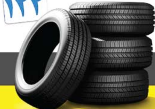
کرافیک دکن نصرانیه