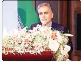
عضو هیات مدیره بانک توسعه تعاون در کارگاه آموزشی مدیران ستادی وابسته در مشهد مقدس در تشریح آثار تسهیلات اعطایی بانکی در متغیرهای کلان اقتصادی اعلام کرد: تسهیلات بانکی آثار متعددی در

بلوچونبور، در اردیبهشت کتاب و کتاب‌خوانی، برنامه‌ی جدیدی برای کودکان و نوجوانان ۷ تا ۱۴ ساله دارد. بر این اساس، اگر فرزند شما هنگام باز کردن حساب بلوچونبور، کد دعوت BOOKJR را وارد کند، ۵۰ هزار تومان هدیه نقدی خرید کتاب دریافت می‌کند. فراموش نکنید برای دریافت این هدیه تنها تا ۳۱ اردیبهشت ماه فرصت دارید. بلوچونبور، محصول بلو بانک سامان و فضای برای آشنایی کودکان و نوجوانان با مفاهیم مالی است که به آن‌ها این امکان را می‌دهد که کارت بانکی به نام خودشان داشته باشند و تراکنش‌های بانکی را با نظارت والدین تجربه کنند. برای باز کردن حساب بلوچونبور، یکی از والدین باید حساب بلو داشته باشد و بعد از نصب اپلیکشن اختصاصی بلوچونبور اقدام به باز کردن حساب برای فرزند خود کنند. در غیر این صورت پدر یا مادر باید یک حساب بلو باز کرده و سپس برای فرزند خود حساب بلوچونبور بسازند. با استفاده از قابلیت افزودن فرزند، پدر یا مادر می‌توانند روی تمام فعالیت‌های مالی فرزندانشان نظارت داشته باشند.