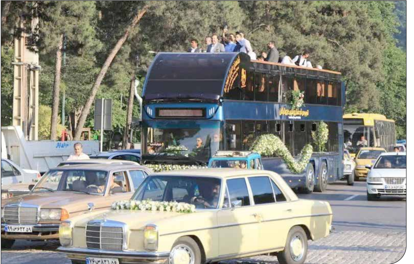
تولید و عرضه

اتوبوس‌های گردشگری طرحی است که از یک دهه پیش در شهرهای گردشگری ایران به صورت محدود مورد توجه قرار گرفته است