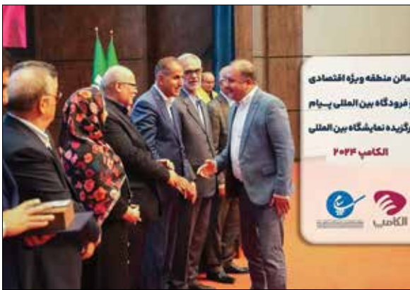
پایین منطقه ویژه اقتصادی و فرودگاه پیام شد تا به‌عنوان شرکت برگزیده در بین‌المللی پیام با حضور ۱۴ شرکت فعال این‌نمایشگاه‌انتخاب‌شود.

همزمان با مراسم گرامیداشت روز فناوری اطلاعات سشنه، ۱۶ مردادماه در سالن همایش نورالرضا از برگزیدگان بیست و هفتمین نمایشگاه بین‌المللی الکامپ، تقدیر شد.